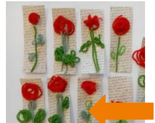
Exposition de productions d'élèves